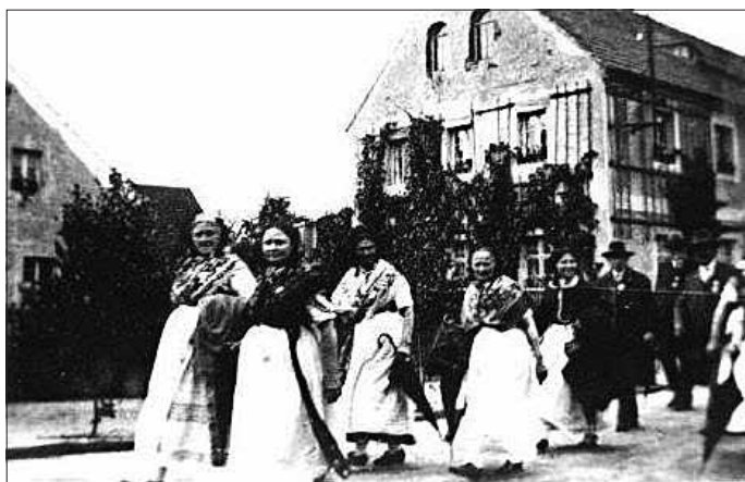
Festumzug 1930 in Königswartha